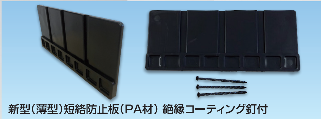
新型(薄型)短絡防止板(PA材) 絶縁コーティング釘付