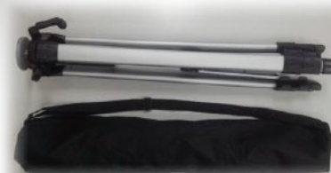
【三脚セット オプション】 三脚・専用ケース