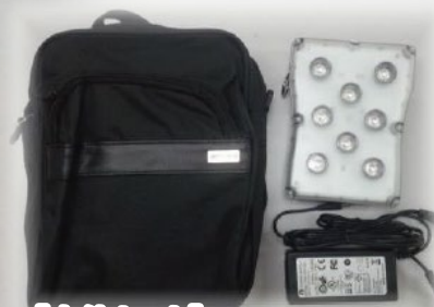
【本体セット】 本体・充電器・専用ケース