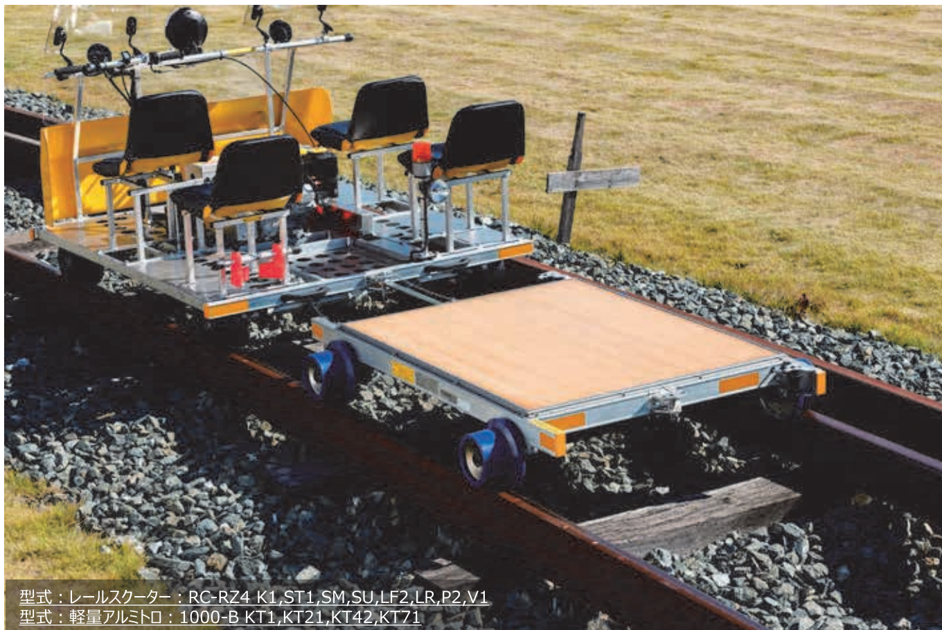
型式：レールスクーター：RC-RZ4 K1,ST1,SM,SU,LF2,LR,P2,V1 型式：軽量アルミトロ：1000-B KT1,KT21,KT42,KT71