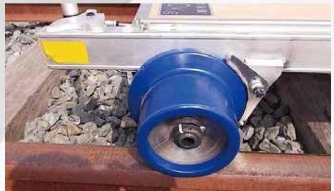
青ホイール仕様(高寿命化実現!!)