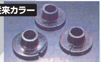
止水油による劣化溶解状況